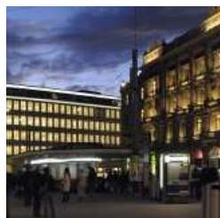
Nach der Finanzkrise: Ein neuer Tag soll über dem Schweizer Finanzplatz anbrechen.

Der Finanzplatz Schweiz soll seine traditionelle Stärke im grenzüberschreitenden Vermögensverwaltungsgeschäft behaupten können. Der Bundesrat will mit neuen Strategien den nötigen Rahmen schaffen. Die Einführung einer Abgeltungssteuer, Selbstdeklarationen von Kunden und ein Dienstleistungsabkommen mit der EU sind mögliche Massnahmen.